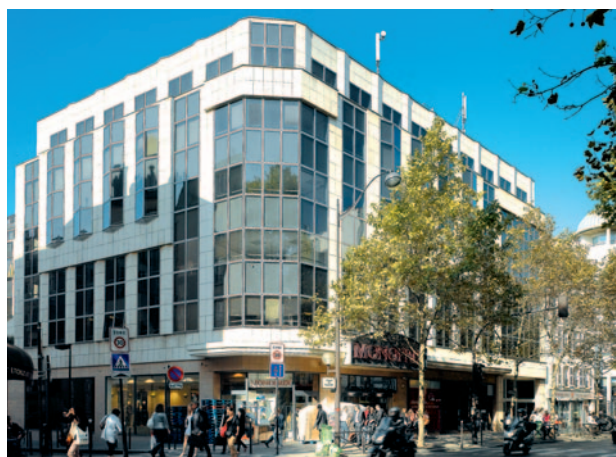
43 avenue de Clichy • Paris 17 ème

Les performances passées ne préjugent pas des performances futures.