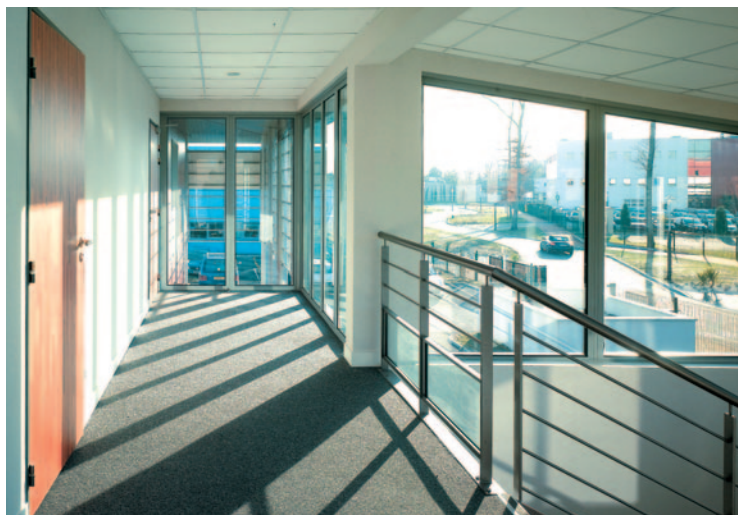
6 allée Pierre-Gilles de Gennes • Mérignac (33)

*3 lots de cellules commerciales sur un "retail park".